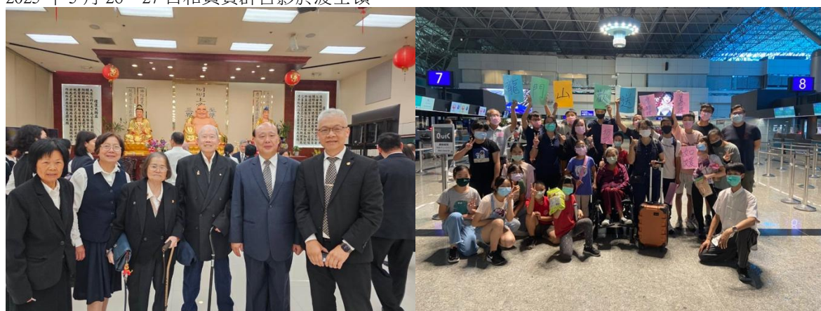
2024 年 4 月 21 日和負責群合影於洛杉磯崇慧佛院、2021 年 8 月 26 日學成返美，龍門山踐行