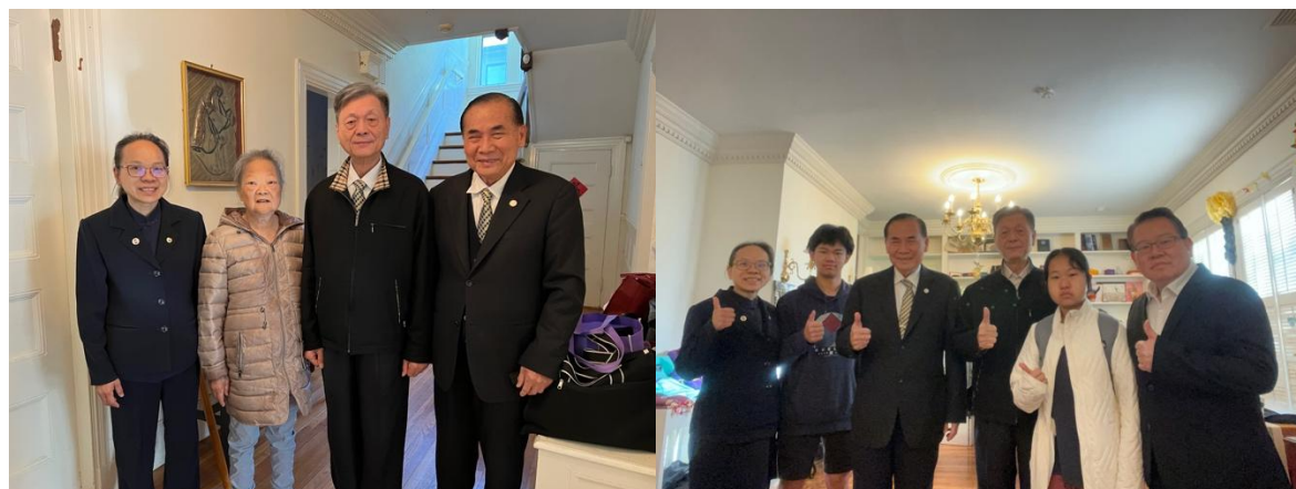
2025 年 5 月 26、27 日和負責群合影於波士頓